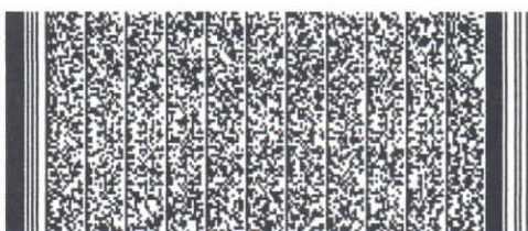
Timbre electrónico SRCel

Verifique documento en www.registrocivil.gob.cl o a nuestro Call Center 600 370 2000, para teléfonos fijos y celulares. La próxima vez, obtén este certificado en www.registrocivil.gob.cl .