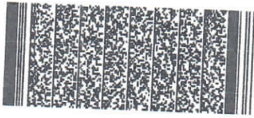
Timbre electrónico SRCel

Verifique documento en www.registrocivil.gob.cl o a nuestro Call Center 600 370 2000, para teléfonos fijos y celulares. La próxima vez, obtén este certificado en www.registrocivil.gob.cl .