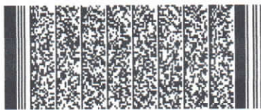
Timbre electrónico SRCel

Verifique documento en www.registrocivil.gob.cl o a nuestro Call Center 600 370 2000, para teléfonos fijos y celulares. La próxima vez, obtén este certificado en www.registrocivil.gob.cl .