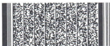
Timbre electrónico SRCel

Verifique documento en www.registrocivil.gob.cl o a nuestro Call Center 600 370 2000, para teléfonos fijos y celulares. La próxima vez, obtén este certificado en www.registrocivil.gob.cl .