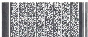
Timbre electrónico SRCel

Verifique documento en www.registrocivil.gob.cl o a nuestro Call Center 600 370 2000, para teléfonos fijos y celulares. La próxima vez, obtén este certificado en www.registrocivil.gob.cl .